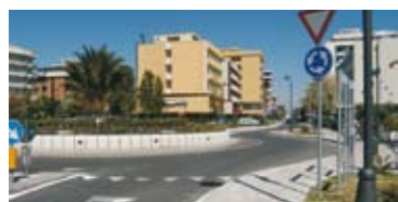
La rotonda di Via Pertini/Pinzon divide la zona colonie dalla città turistica

Tanto per cominciare non è possibile che una città vocata al turismo non investa sulla riqualificazione urbana di un'area vasta del proprio territorio come la zona colonie e il lungomare Pinzon.