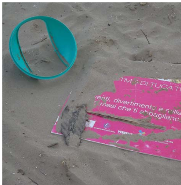
il Tuca Tuca è finito