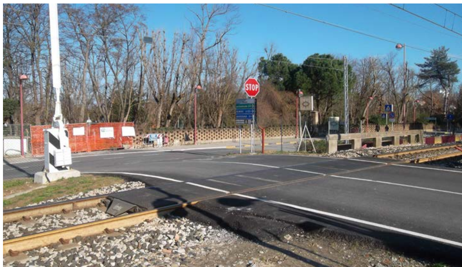
Perchè questo passaggio a livello non è inserito nel PSC?