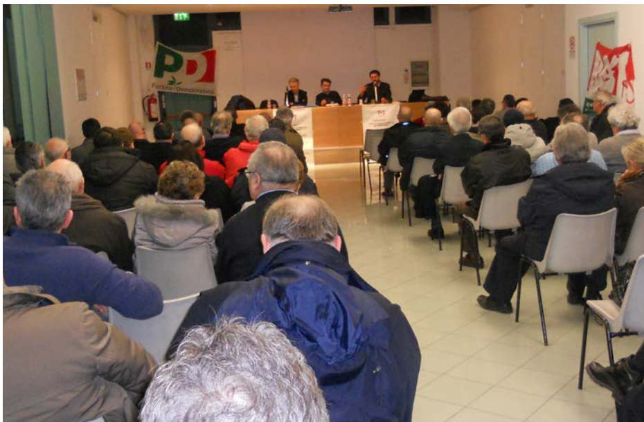
Un'immagine dell'iniziativa del 24 febbraio promossa dal Partito Democratico sul PSC.

La riqualificazione dell'asta fluviale e del porto sono fondamentali per il rilancio dell'economia del paese. Peccato che ad oggi le sole infrastrutture lì presenti siano: deposito molluschi (definito mercato ittico dall'Amministrazione), un ponte viola di notte, qualche verniciatura eseguita alle balaustre del vecchio ponte. Nel nuovo PSC nessun cenno a quest'area, né per ciò che concerne la riqualificazione ne tantomeno per la sua riqualificazione viaria e di mobilità. Neppure un'ipotesi minima di miglioramento dell'accesso che renda agevole e sicuro il traffico. Idee progettuali non pervenute; forse si è speso troppo nel magazzino mitili, nel ponte, ecc.. così resterà per anni senza soluzione l'accesso principale della città. Per ora solo una delimitazione grafica di una rotonda nell'area di accesso, disegnata nella cartografia del PSC; ma ci pare una realizzazione di là da venire.