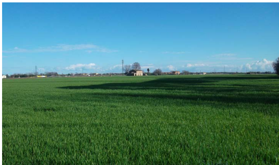
Immagine della campagna di Bordonchio ove dovrebbe sorgere un grande Centro Commerciale

Il PD non ci sta e nelle prossime settimane continuerà ad incontrare i cittadini per conoscere le loro opinioni e osteggiare questo scellerato progetto.